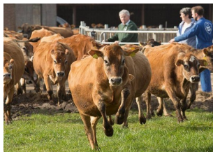
Bij Boer Bart